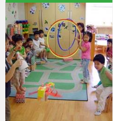
추후활동 및 평가